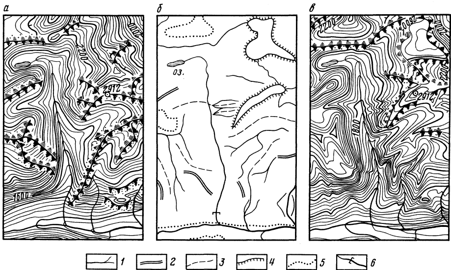
Рис. 1. Пример исправления рисовки рельефа на топографической карте горного района по космическому фотоснимку.

а — исходная карта масштаба 1:200 000, увеличенная вдвое; б — схема дешифрирования орографических элементов; в — исправленная карта. 1 — гребневидные водоразделы, 2 — выположенные водоразделы, 3 — тальвеги, 4 — бровки, 5 — подножия и вогнутые перегибы склонов, 6 — висячие устья