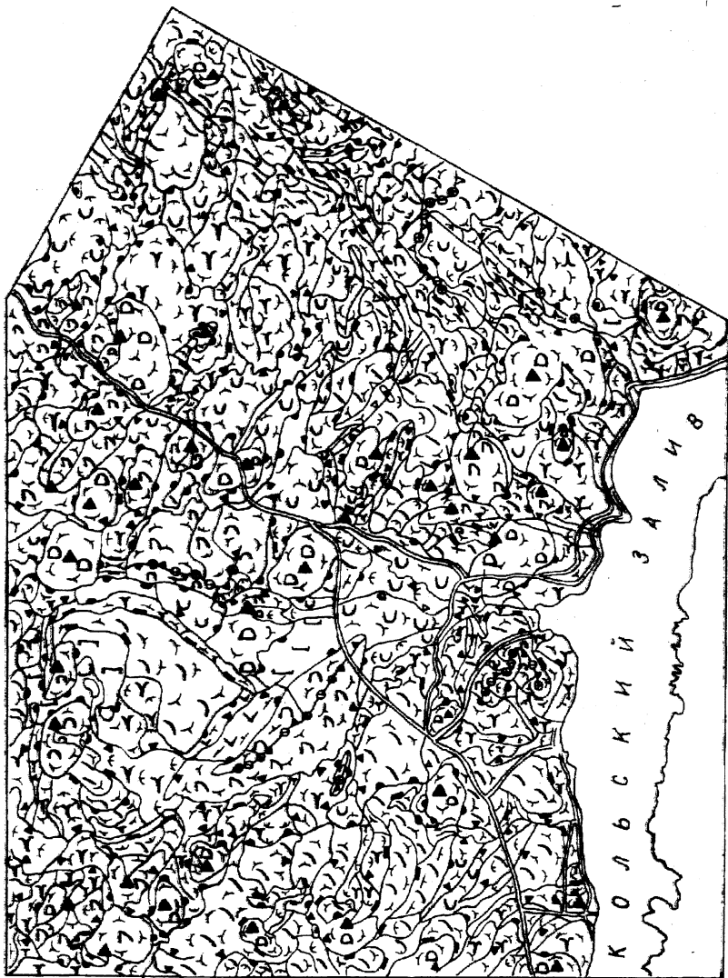
Рис. 2. Геоморфологическая карта района

ЗП2) точки положительных ундуляций гребневых линий ( C_1^+ ) и отрицательных ундуляций килевых линий ( C_2^- ); 3) точки пересечения линий выпуклых перегибов и точки пересечения линий вогнутых перегибов с морфоизографами — соответственно C_{5-7} и C_{6-7} .